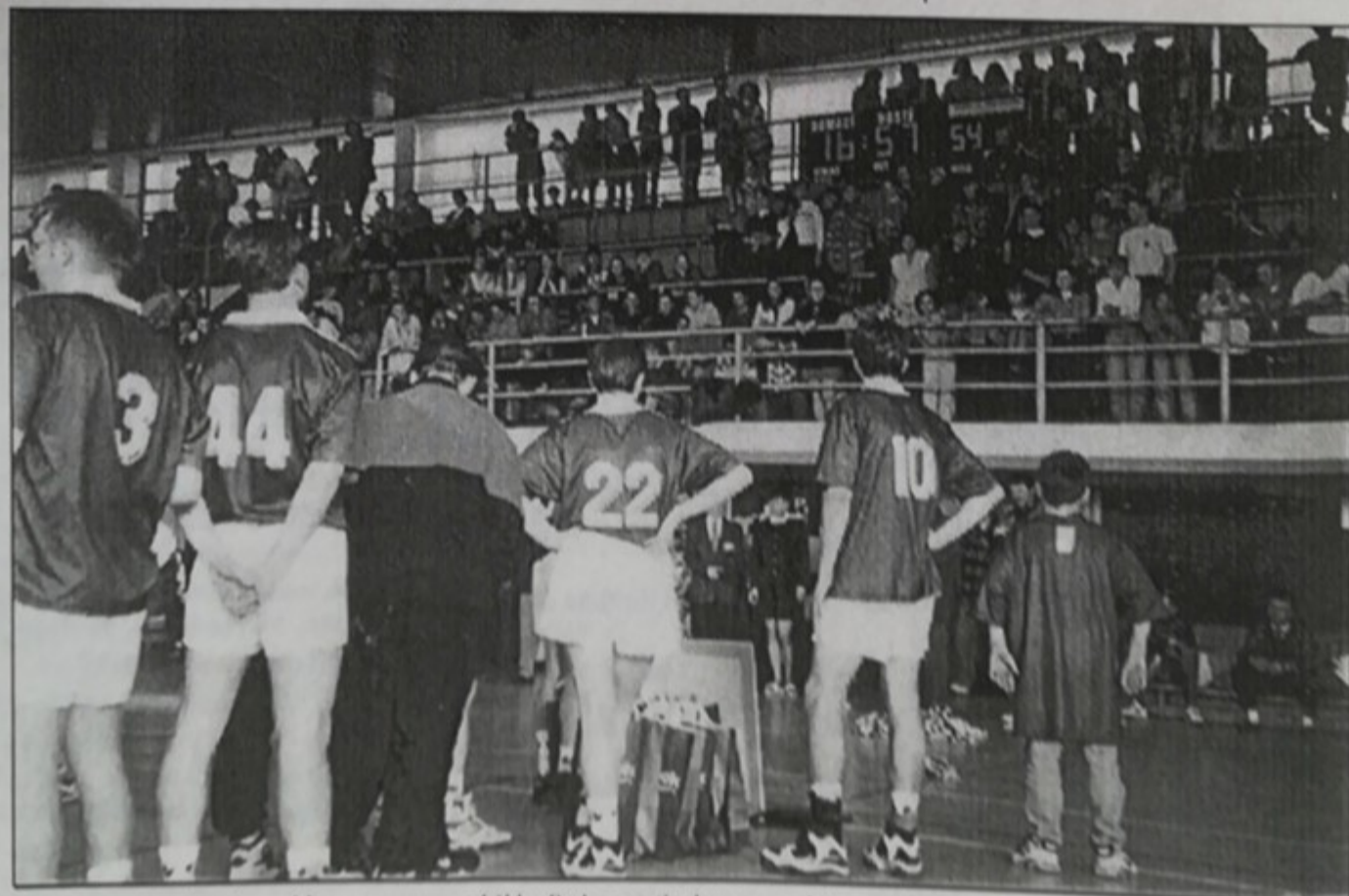
Ligové soutěže, včetně první ligy, se znovu rozběhly. Bude na jejím konci na trůně opět Kolín jako v loňsku v Chomutově?