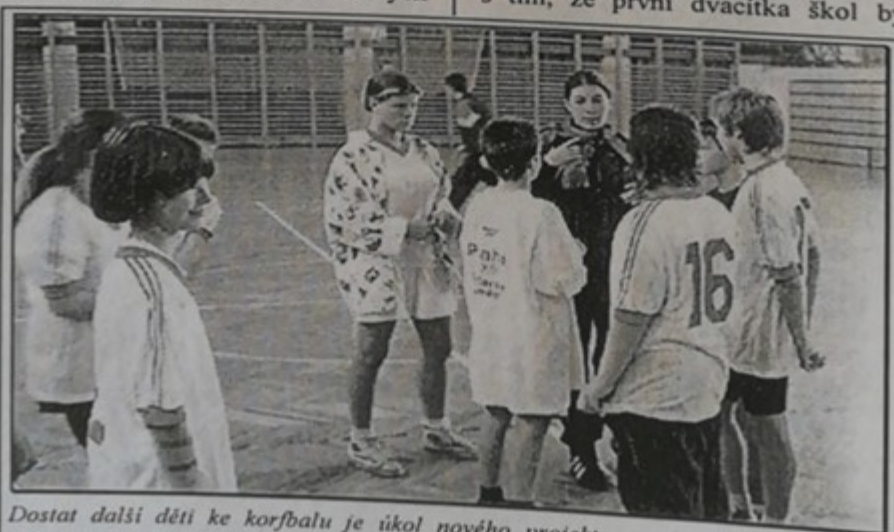
Dostat další děti ke korfbalu je úkol nového projektu, s nímž přichází Český korfbalový svaz

Projekt, na nějž bude část finančních prostředků čerpána také z pomoci nabídnuté holandskou korfbalovou asociací KNKV, by měl pomoci také klubům, na které se vztahuje povinnost mít žákovské nebo dorostenecké družstvo, pokud hrají první či druhou ligu. Bez větší námahy tak totiž mohou získat